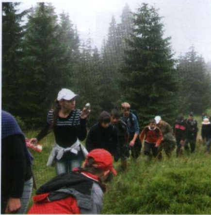
Сходження учасників табору — експедиції «Ойкос» на г. Говерлу