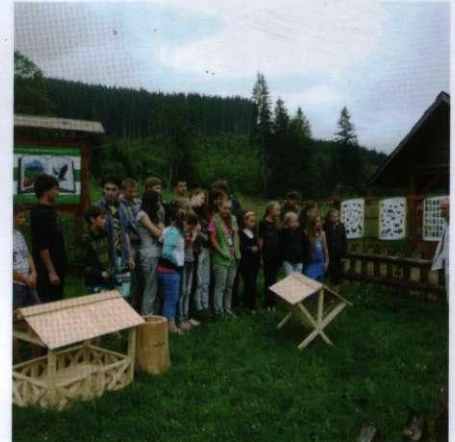
Навчально-польова практика юних орнітологів на натуралістичній базі «Едельвейс»

впровадженню інформаційних технологій, пропаганді своєї роботи через засоби масової інформації.