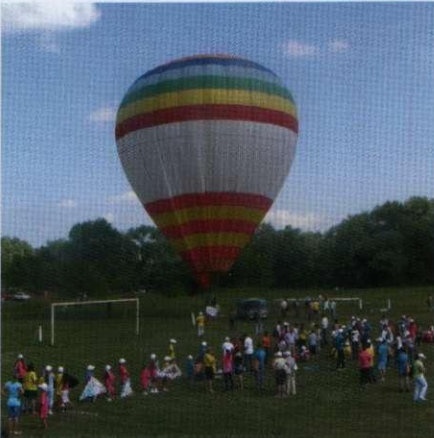
Екологічна акція «Тиса — молодша сестра Дунаю»