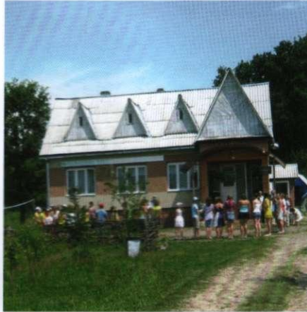
Обласний профільний табір «ЮННАТ» на натуралістичній базі «Нарцис»