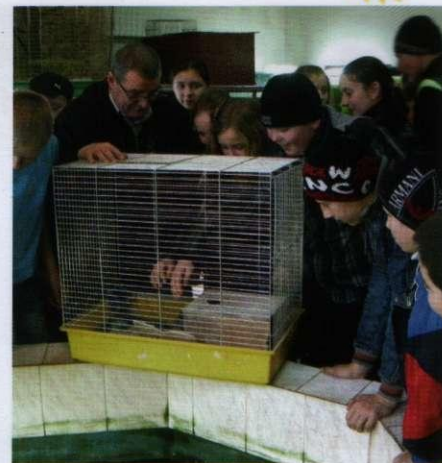
Заняття з юннатами в кутку живої природи

На сьогодні у ЗОЕНЦ працюють 34 педагоги. У 74 творчих учнівських об'єднаннях 18 натуралістичних профілів навчаються 1105 учнів.