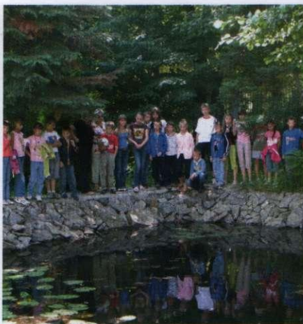
Заняття з юннатами біля навчально-декоративної водойми