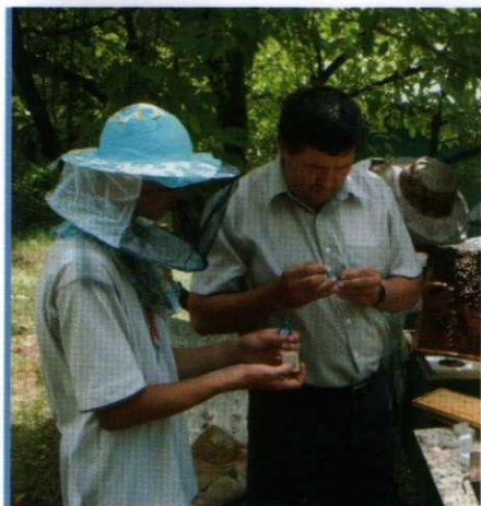
Заняття з юннатами на юннатівській пасіці