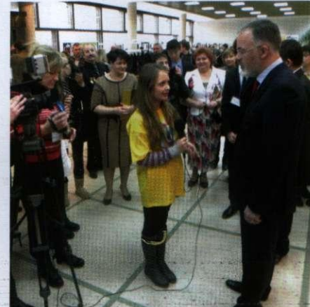
Інтерв'ю з міністром освіти і науки Д.В. Табачником на Всеукраїнській виставці-звіту «Країна юних майстрів»