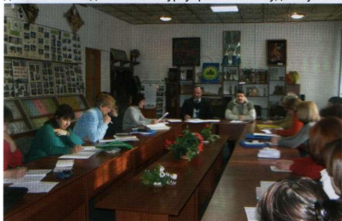
Засідання методичної ради

Юннати ЗОЕНЦ — активні учасники міжнародних, всеукраїнських, обласних заходів: «Мій рідний край — моя земля»; «Український сувенір»; «Новорічна композиція»; конкурсів колективів екологічної просвіти, екологічних експедицій; дитячого молодіжного конкурсу-фестивалю аудіовізуальних мистецтв «Кришталеві джерела»; фестивалю «В об'єктиві