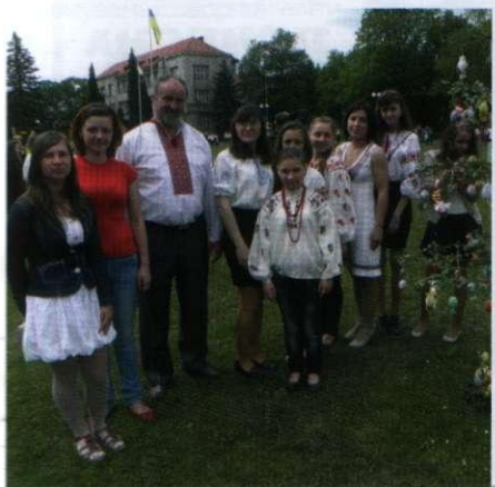
На обласній виставці «Воскресни, писанко!»

Значну увагу педагогічний колектив приділяє методичній роботі, вивченню прогресивного досвіду колег, розробці та